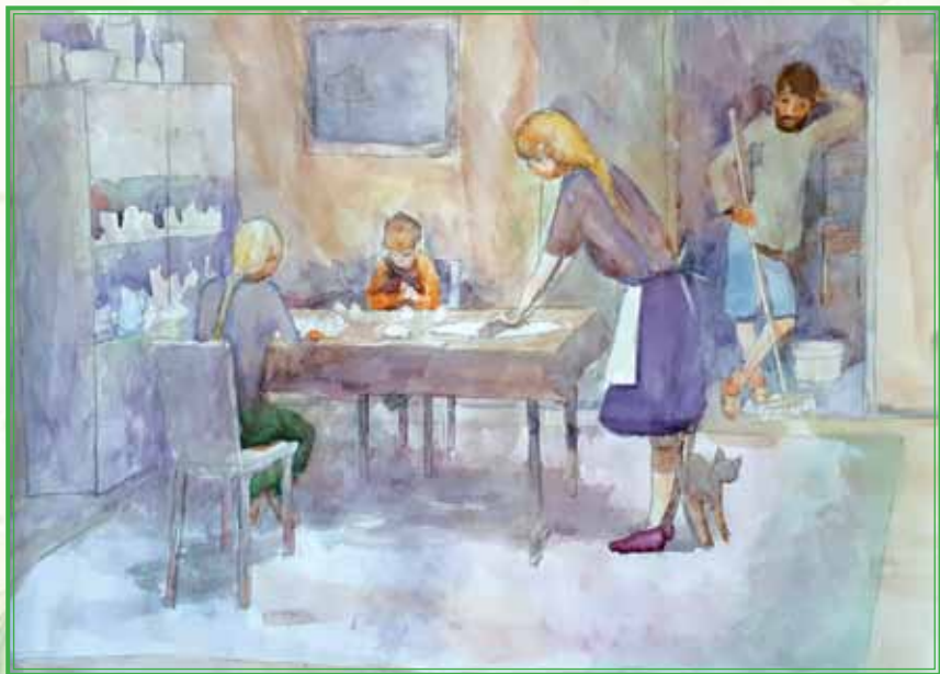
Картина «Стряпаем пельмени»