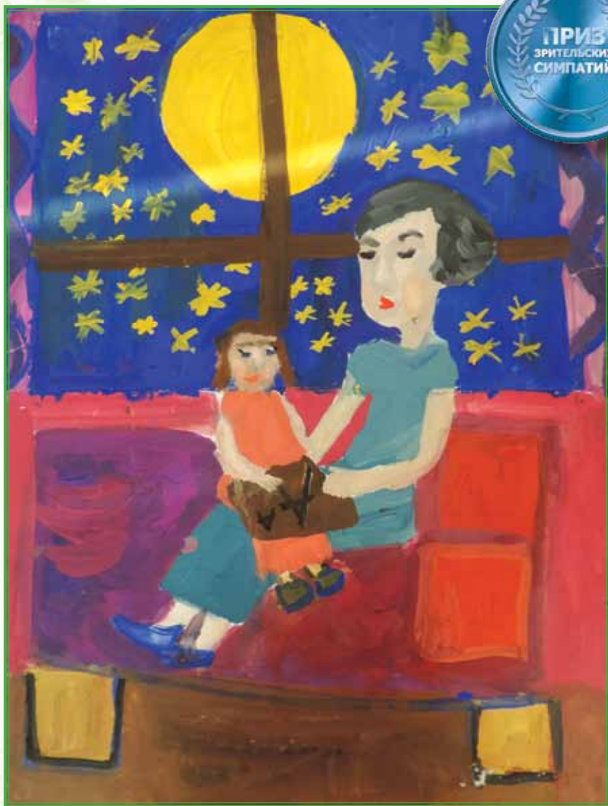
Картина «Сказка на ночь»