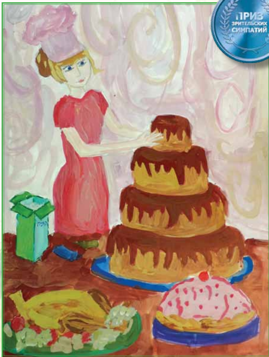
Картина «Праздничный торт для мамы»